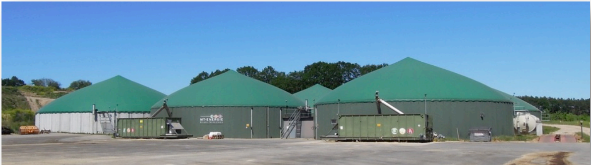
Biodigestor construido en clima frío

La construcción de estos biodigestores tiene un costo bastante elevado y representa una enorme inversión para las empresas establecidas en zonas tropicales y/o en países de bajo desarrollo industrial.