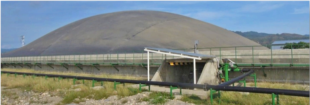
Biodigestor construido en clima tropical

Adicionalmente, hay que tomar en cuenta que en algunos países tropicales, como en los centroamericanos, ocurren temblores con bastante frecuencia, que pueden ocasionar daños considerables a estas instalaciones sobre tierra.